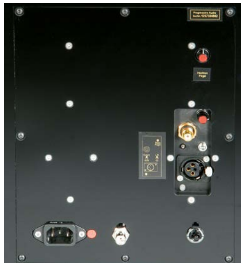
Das rückwärtige Anschlussfeld mit XLR- und Cinch-Eingang, Pegelreglern, Ferneinschaltung, Netzschalter und -buchse sowie Ground-Lift

Jedes Chassis wird von einer eigenen, im Eingang diskret aufgebauten Endstufe